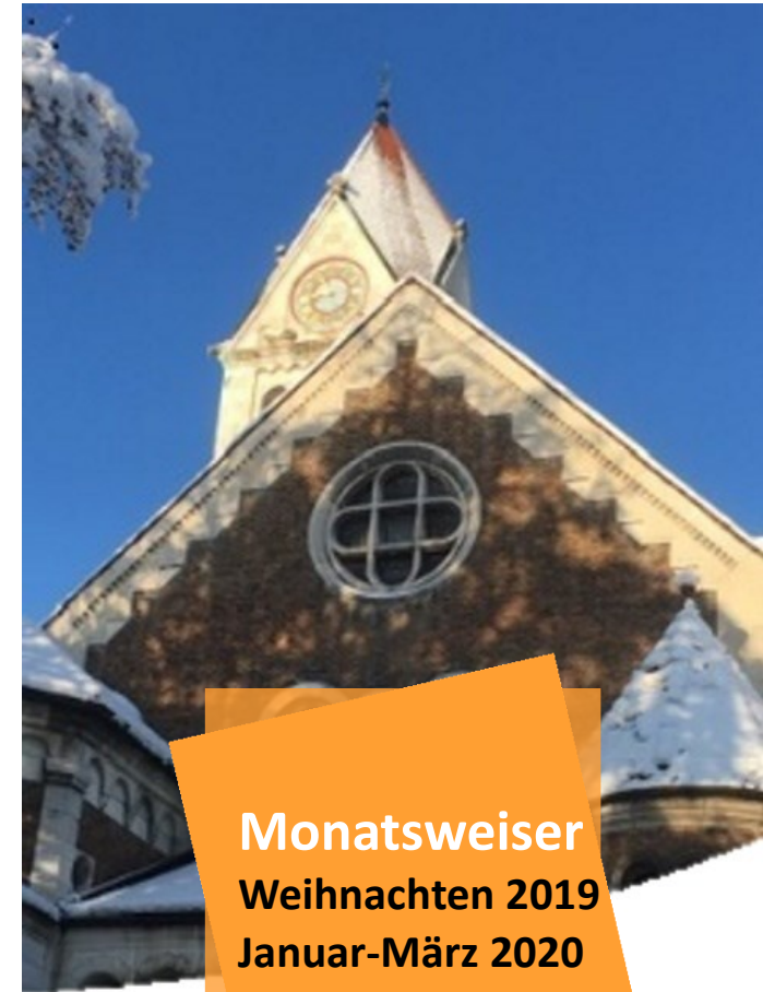
Titelbild: Pfarrkirche St. Cäcilia, Regensburg, Ostfassade.

Monatsweiser Weihnachten 2019 Januar-März 2020